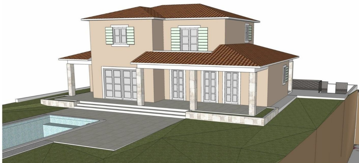
JUGOISTOČNO I SJEVEROISTOČNO PROČELJE