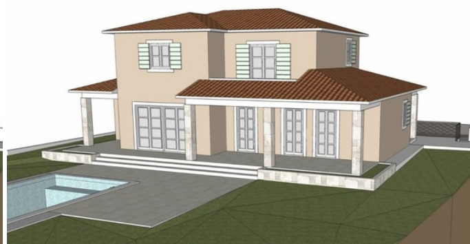
JUGOISTOČNO I SJEVEROISTOČNO PROČELJE

Sveta Nedelja, ki se nahaja v osrednji Istri, je znana po mirnem podeželskem okolju in očarljivi pokrajini. Občina obsega številne slikovite vasi, obdane z vinogradi, oljčnimi nasadi in nedotaknjeno naravo. Sveta Nedelja ponuja pristno doživetje Istre z bogato zgodovino, tradicionalno arhitekturo in gostoljubnimi ljudmi, zaradi česar je idealen kraj za sprostitev in raziskovanje istrskega načina življenja.